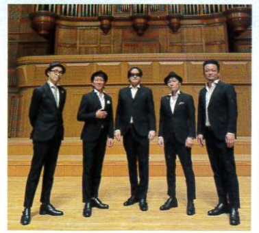
チキンガーリックステーキ (大和丸なすPR大使)